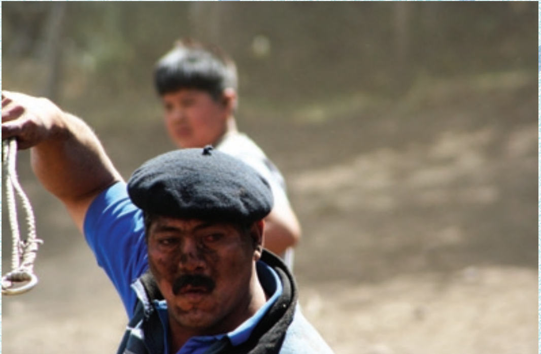
"Se dirige la mansera y también echar un pial."