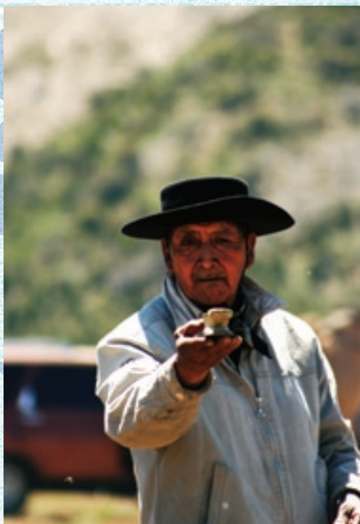
"Con la taba en la mano ni las moscas se me arriman..."