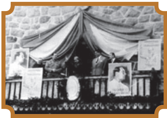
Eva Duarte de Perón y Juan Domingo Perón en Bariloche, 1950