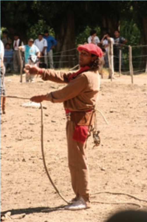
"Menos los peligros teme quien más veces los venció."