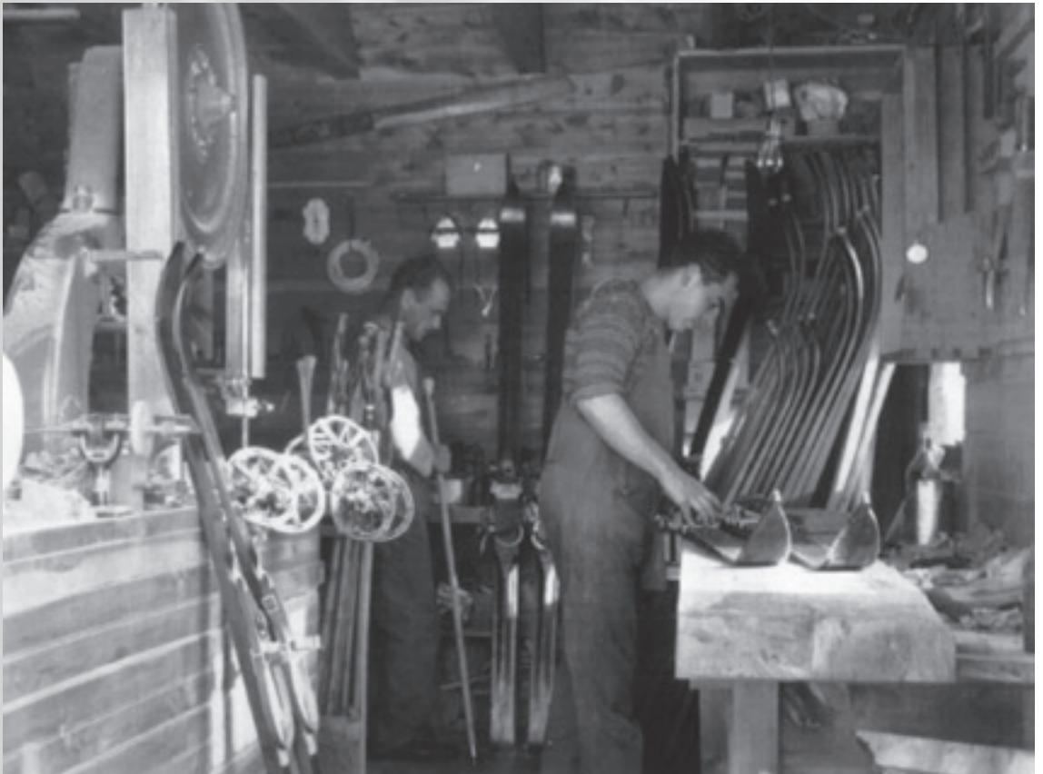
Interior de la fábrica de esquíes Tronador