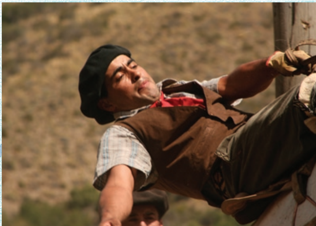
"¡Epa que se hamaca el zaino!"