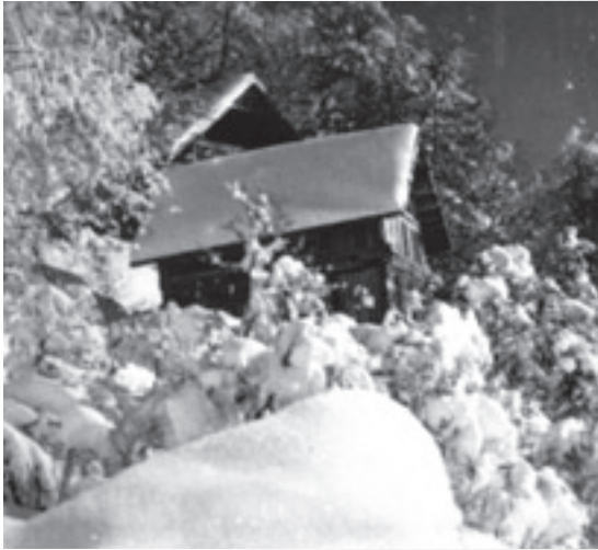
Casa de Otto Meiling (detrás techo del refugio Berghof )

A fines de 1939 Meiling decidió contratar la construcción de un refugio andino en el cerro Otto,