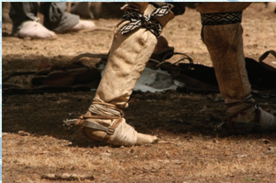
"No pinta quien tiene ganas, sino quien sabe pintar."