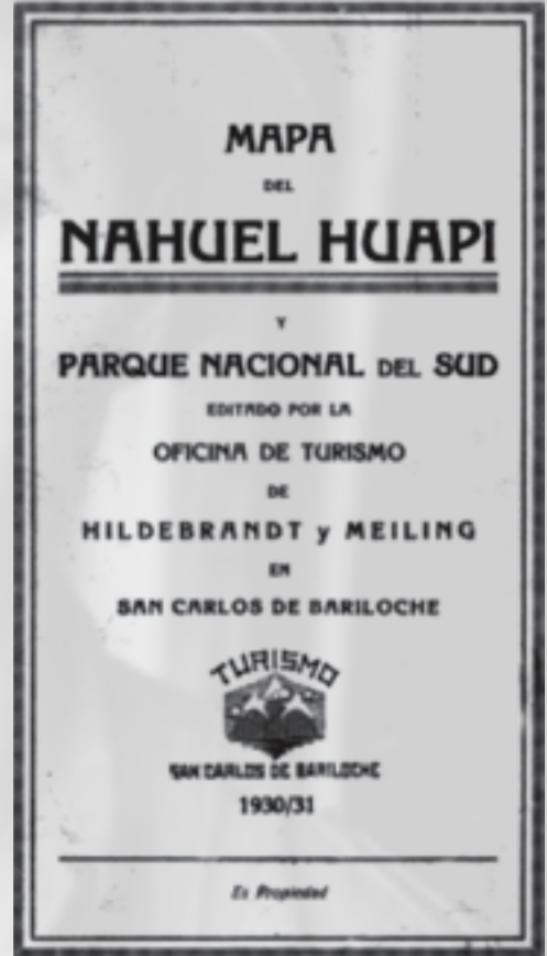
Mapa del Nahuel Huapi editado por la Oficina de Turismo Hildebrandt y Meiling