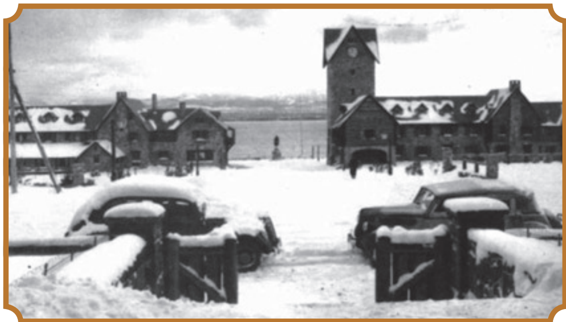
Centro Cívico de San Carlos de Bariloche en invierno, 1950.