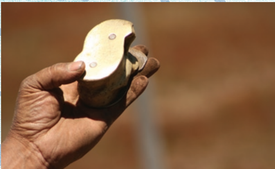
"Naides acierta antes de errar."

CONTACTO: www.jorgepiccini.com.ar / info@jorgepiccini.com.ar