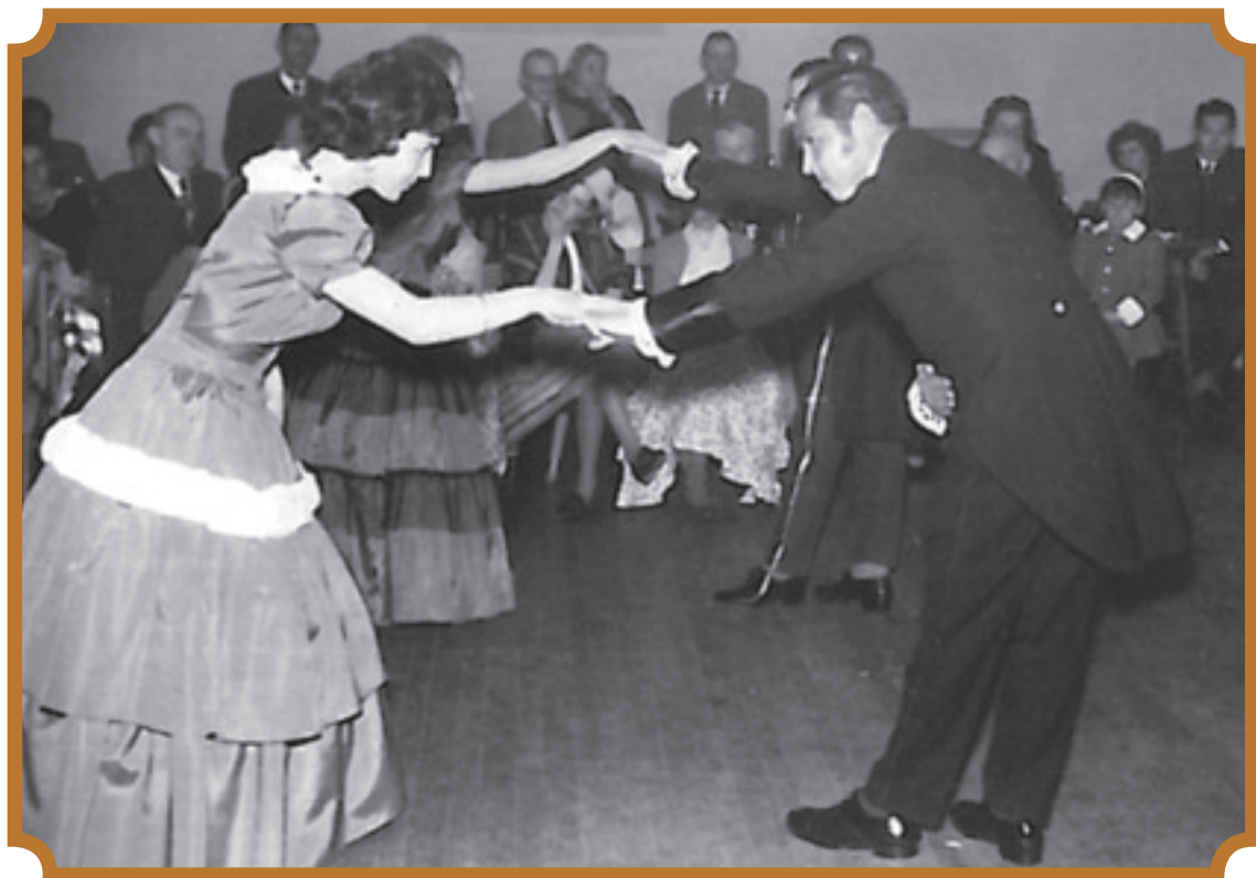
Baile de salón en el Bariloche de los años '50.

la línea sur, expulsadas por la falta de trabajo y la expoliación de sus tierras por parte de comerciantes e intermediarios. En la ciudad no era fácil la vida para las clases trabajadoras. Entre los varones se registraban un ochenta y seis por ciento de analfabetos, la cantidad de embarazos de mujeres entre trece y quince años de edad iba en aumento y el estupro -sin condena- era una práctica frecuente. Según un informe de 1943 de la Asociación Amigos de Parques Nacionales muchas familias vivían en ranchos destartados durmiendo con los perros para entrar en calor.