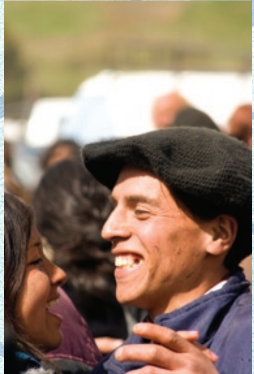
"En aquella ocasión me hacía buya el corazón como la garganta al sapo."