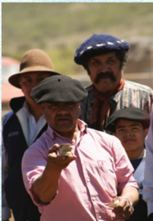
"¡Y qué jugadas se armaban cuando estábamos riunidos!"